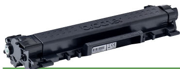
TN243BK Sort toner

Brother originale forbrugsstoffer garanterer kvalitet og ro i sindet